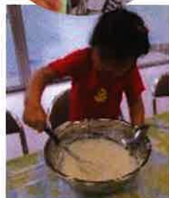
みんな大好きクッキング♥