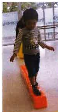
療育・集団活動にも 頑張っています。