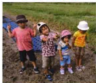
にんじんの種植えに行きました。