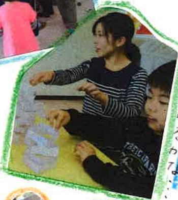
制限時間内にとれただけ積の上でラッパを吹くかな!