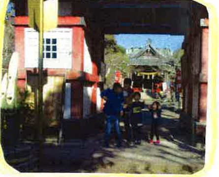
1/4 初詣に行ってきたよ