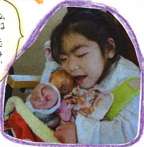
私は玉ねぎも運ぶわね。