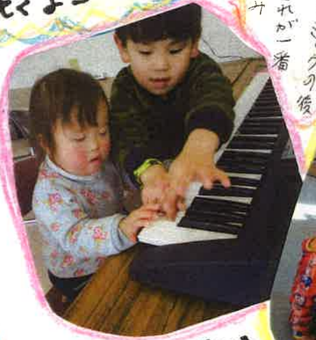
リトミックの後、は、これが一番楽しか