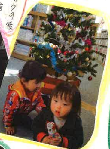
図書館に行ってきたよ