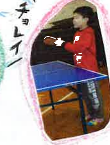
冬休み 楽しかったね