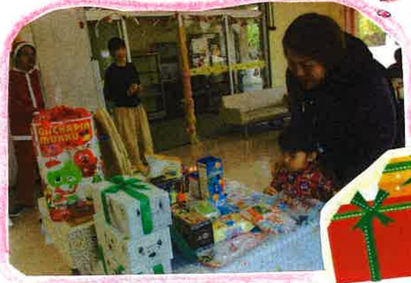
どれにしようかな