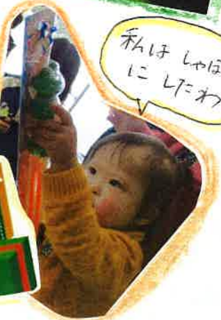
私はしゃぼん玉にしたいわ