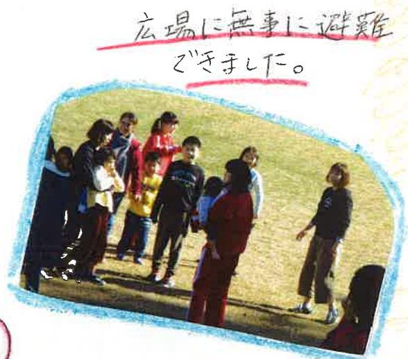
広場に無事に避難できました。