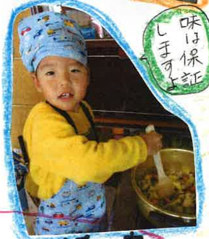
味は保証しますよ!