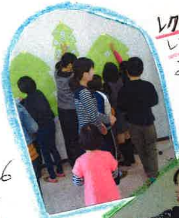
レクリエーションもしたよ。みんなでツリー完成させたね。