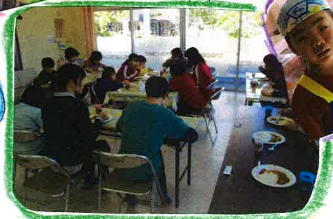
おかわりも沢山したね!