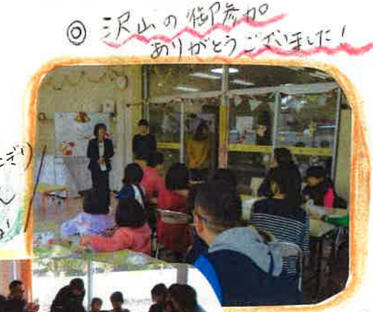
◎ 沢山の参加ありがとうございました!