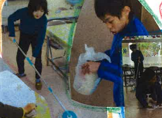
年末の大おとし 元氣張りした