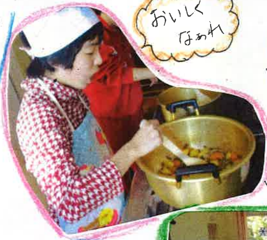
完成したカレー&ハヤシライスは大好評でした!