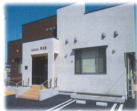
※写真は、道路から見える部分になります。 ぽけっとの玄関は、建物に向かって右側の方にあります。