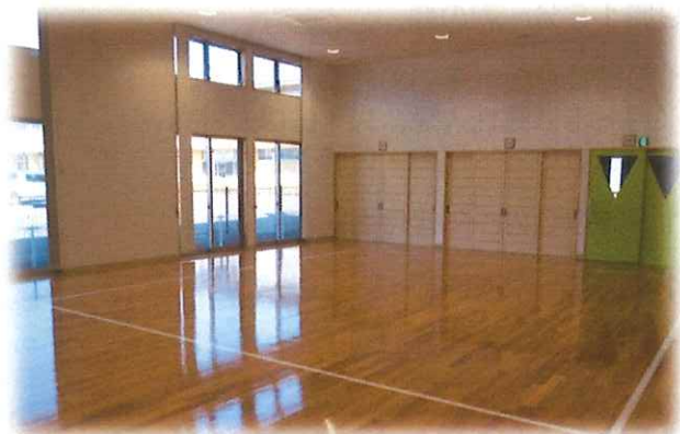
※ぽけっとのホール内の写真です。