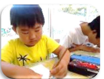
自分に手紙を書いて、ポストに入れました