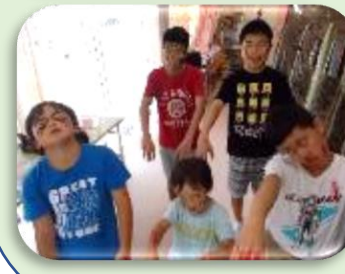
おばけ屋敷で、おばけになったぞ～

○夏休みの様子○ 今年は、短い夏休みとなりましたが、みんな楽しくいろいろな事に挑戦しました。