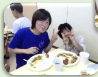
みんなで食べると おいしいね♡