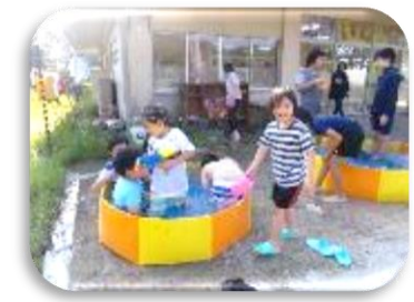
噴水マット やプールで 水遊びを しました♪

○夏休みの様子○ 今年は、短い夏休みとなりましたが、みんな楽しくいろいろな事に挑戦しました。