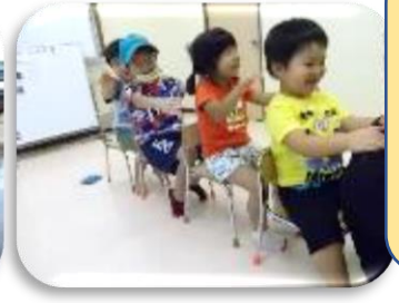
いろいろな レクレーシ ョン!!