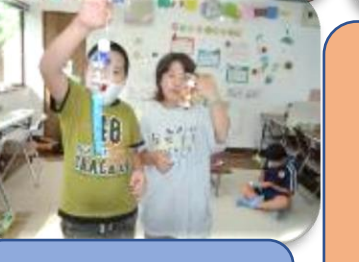
船を作っ て、プー ルで走ら せたよ!