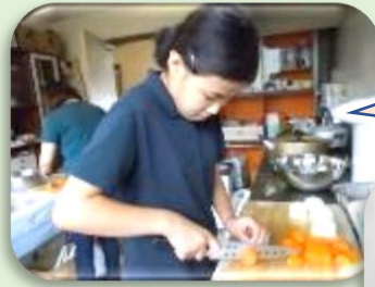
カレーを作ったよ

○遠足○ 9月5日に遠足の予定でしたが、台風10号接近のため、館内ですごしました。カレー作りやモンスターアドベンチャー（お化け屋敷）等をしてとても楽しいイベントになりました。