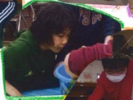
水の中にアレ落とすのね