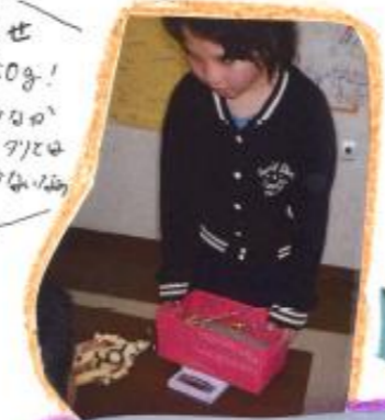
目指せ350g! はやぶさのてんぷらはいかにあじい