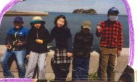
早く普通の日常が当たり前のように