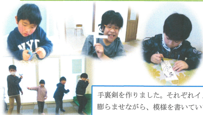
手裏剣を作りました。それぞれイメージを膨らませながら、模様を書いていました。