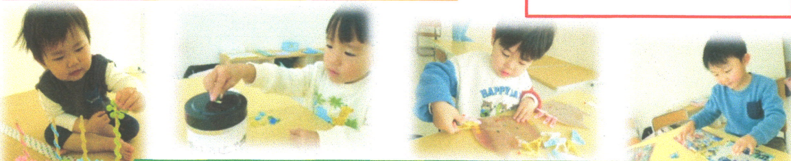
指先を操作する力や集中力を高める課題に取り組んでいます。