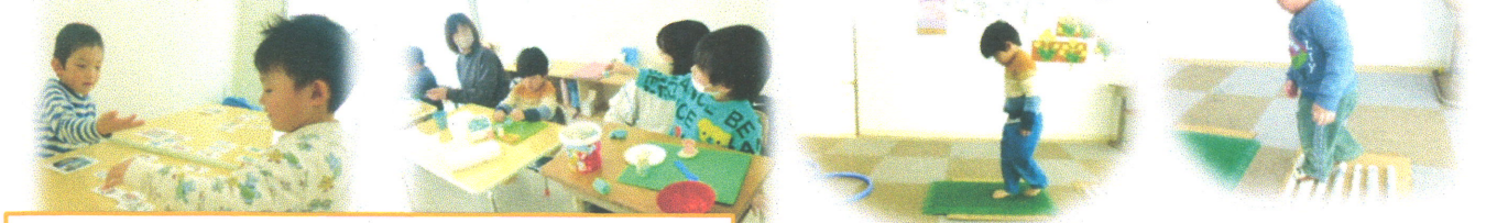
遊びを通して、お友達とのコミュニケーションを高めています。