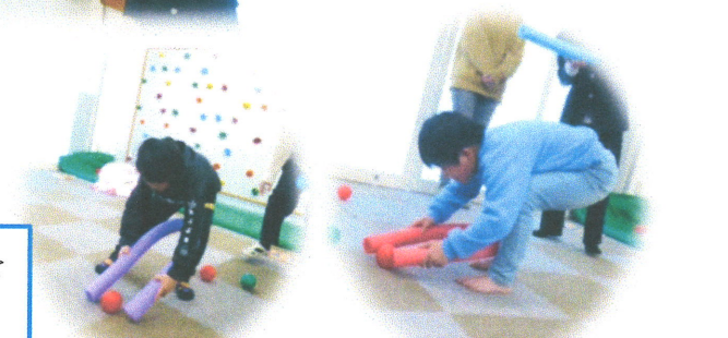
プールステックを使用し、カラーボールをつかんでいきました。力加減を調節しながら集中して取り組んでいました。