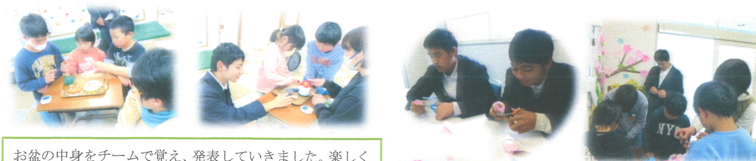
お盆の中身をチームで覚え、発表していきました。楽しくワーキングメモリーの向上、協力する力も高めています。