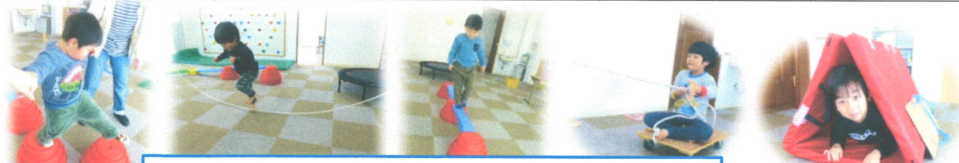
いろいろな運動課題を設け、繰り返し行うことで、遊びながら様々な体の使い方を身につけています。