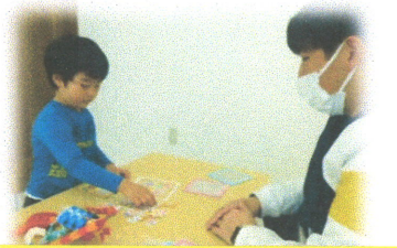
興味のある物から楽しく取り組んでいます。