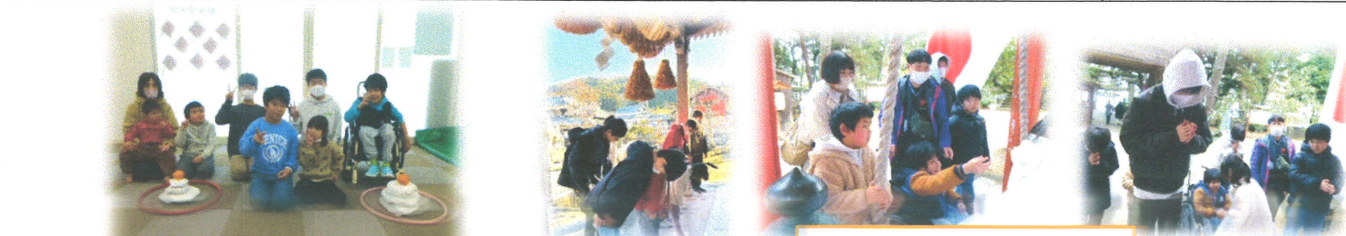
初詣に行ってきました🍡