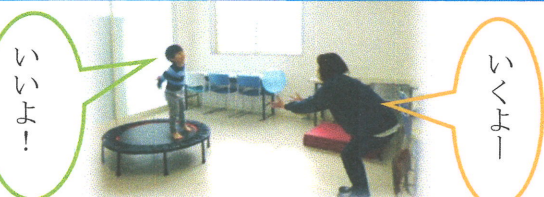
言葉のやり取りで、相手を意識しながらのボール遊びをしました。