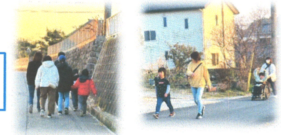
地震を想定しての避難訓練で、小原集会場まで歩いて行きました。