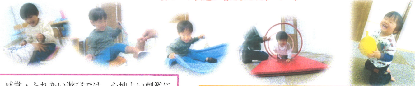
感覚・ふれあい遊びでは、心地よい刺激にニコニコの子ども達でした😊