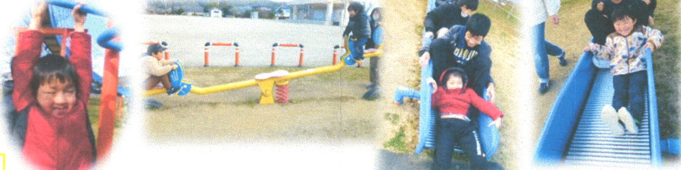
未就学児さんは小、中学生のお兄さん、お姉さんとたくさん遊びました。