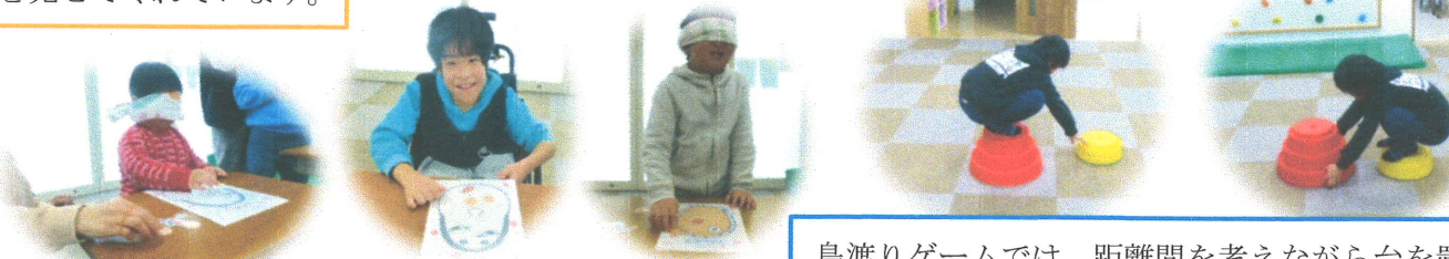
目隠しをしての福笑い。完成した顔を見てみんなで大笑いしました♪