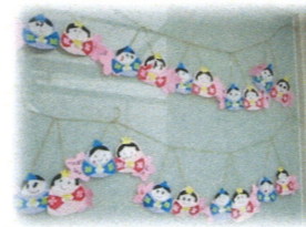
おひなさま制作をしました。表情豊かなかわいい飾りができました。