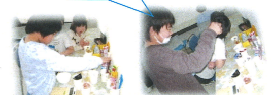
お買い物学習で、おやつを買いに行ったり、金額を見ながら、おやつを選んでいきました。電卓の使い方も上手になっています。