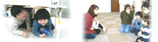
警報音が鳴ると、遊びを止めて、素早く机の下にもぐることができていました。