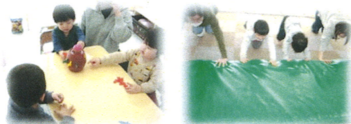
お友達を意識し、一緒に取り組む活動も増えてきました。