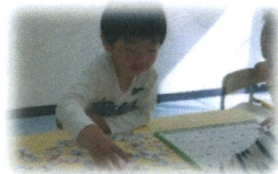
パズルでは、集中力や空間認知能力を養っています。