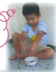
太鼓やあずきのジャーとなる音を楽しんでいました。