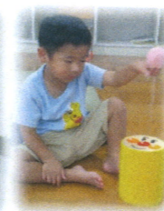
ひっくり返しゲームをしました。タイマーがなるとひっくり返すことをやめ、「椅子に座る」のルールがバッチリでした☆