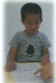
鉛筆の持ち方や筆圧を目的にプリント課題にも取り組んでいます。