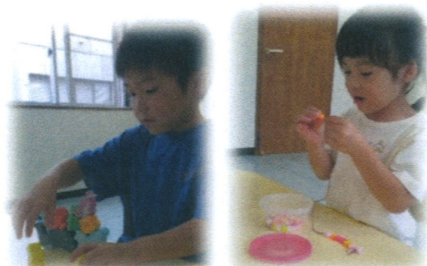
手指の使い方、集中力、想像力を目的にバランスつまみやビーズ通しを行っています。