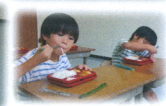
自分の机をきれいに拭いて、お弁当を運び昼食の準備をしています。

社会福祉法人 秀溪会 児童発達支援事業・放課後デイサービス事業 いきいきっこクラブ 〒873-0412 大分県国東市武蔵町古市1134-1 TEL 0978-64-8200 携帯 090-5729-2303