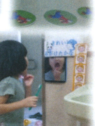
お友達の歯磨きの準備ができるまで待ち、一緒に動画を見ながら歯磨きをしています♪「きれいになったかな～」と鏡を見て確認しています☆