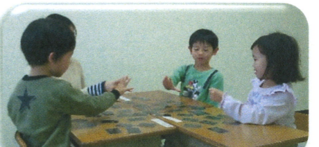
カード遊び🎴トランプ♠ 神経衰弱やババ抜き等、勝敗のある遊びを通して、感情コントロールの練習をしています。