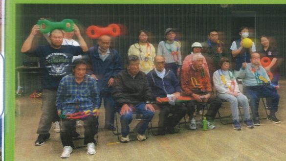
3B体操 (おごいバランスでしょう!!)