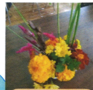
12月と1月の手芸の作品