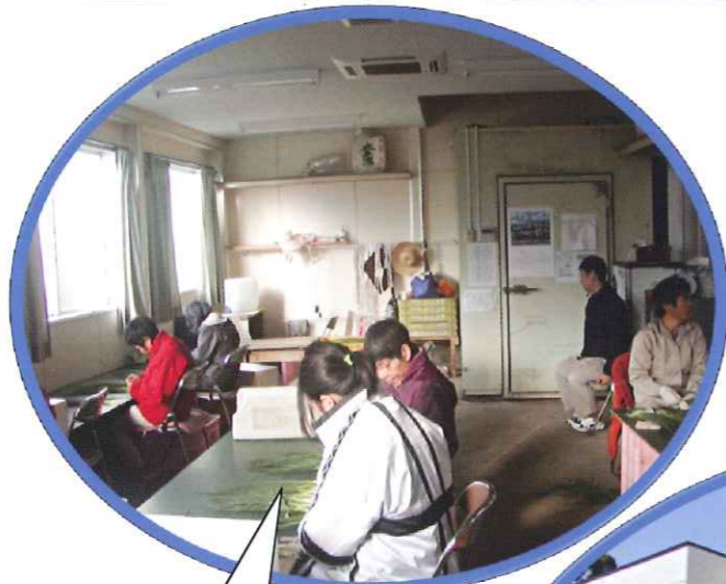
ネギの出荷準備中です!