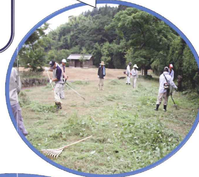
一生懸命、草刈をしています(@_@)