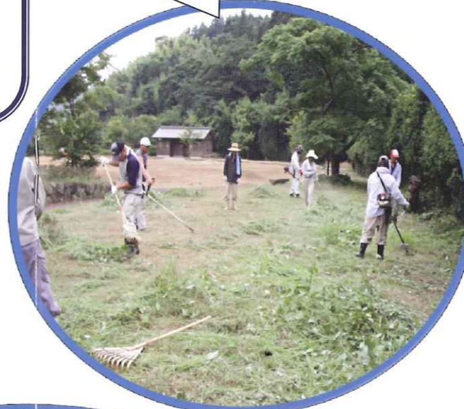
一生懸命、草刈をしています(@_@)