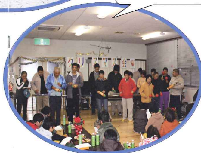
毎年、楽しいクリスマス会を企画しています♪♪