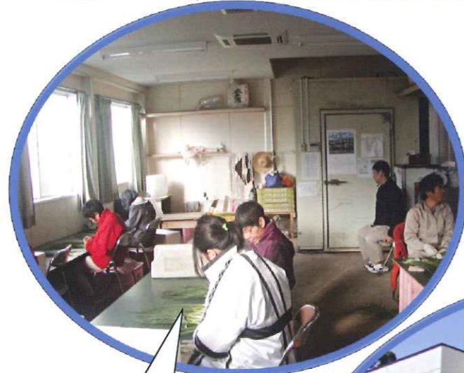
ネギの出荷準備中です!