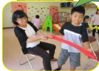
スーパーボール作りに挑戦